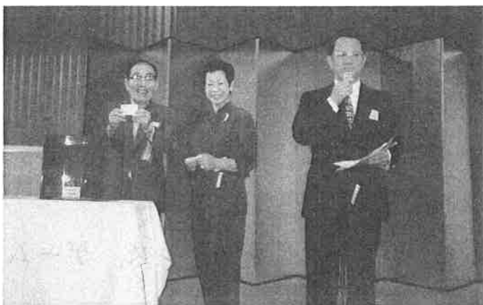
景品提供者の植木会長(左)