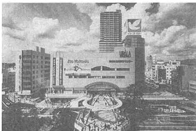
土浦駅前再開発ビル「ウララ」