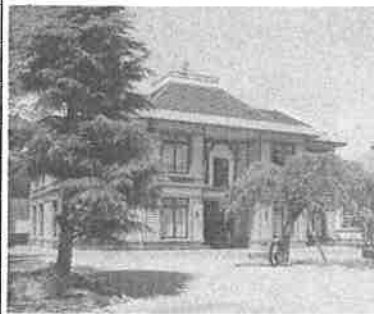
同窓会館兼アリーナ（進修記念館）

この三大学は、筑波大学とともに本校の大学受験における基幹大学であり、その不振要因の分析検討の上に、指導態勢の見直しと戦略の練り直しをはかることが喫緊の要となろう。主な大学の合格数は左表の通りである。ただし、平成十年度入試については、三月二十七日までに判明した集計数なので、詳しくは六月中旬発行予定の「進学要覧」を参照されたい。