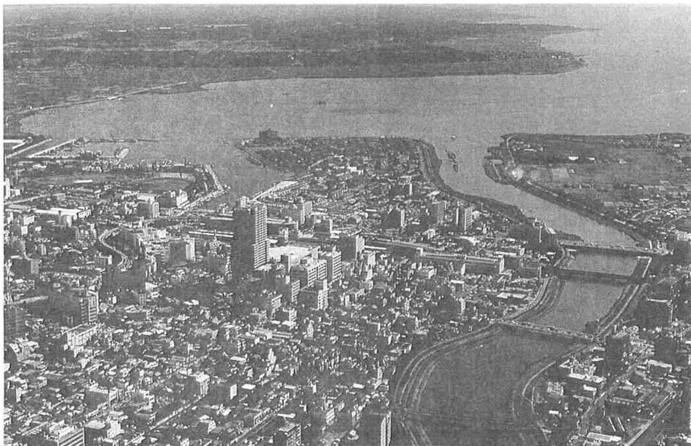
霞が浦方面土浦市内航空写真

事務局 〒160-0022 東京都新宿区新宿2-2-10 サニープラザ新宿御苑1102 大野金一法律事務所内 ☎03-3357-4311 FAX 03-3357-4312